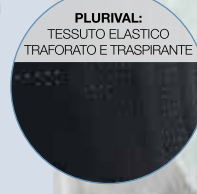
PLURIVAL: TESSUTO ELASTICO TRAFORATO E TRASPIRANTE