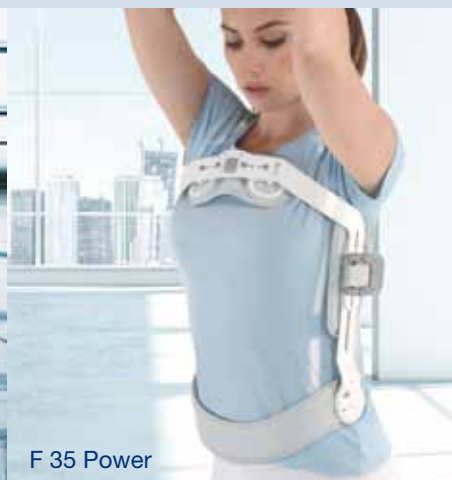
F 35 Power