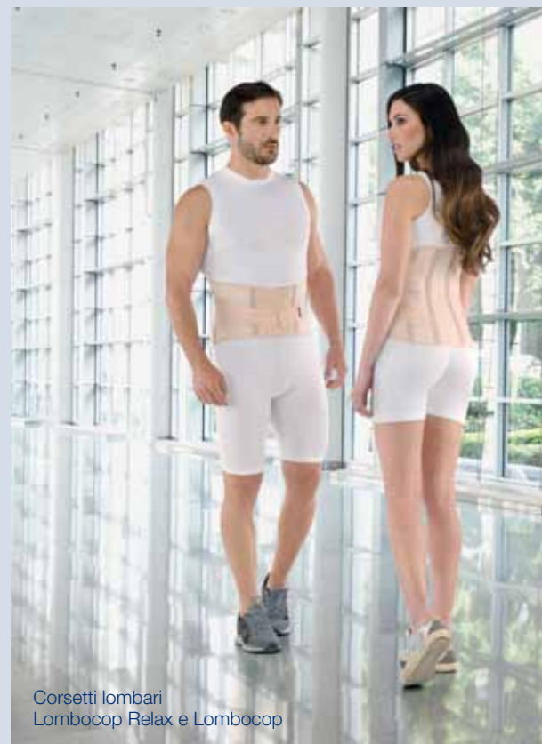
Corsetti lombari Lombocop Relax e Lombocop