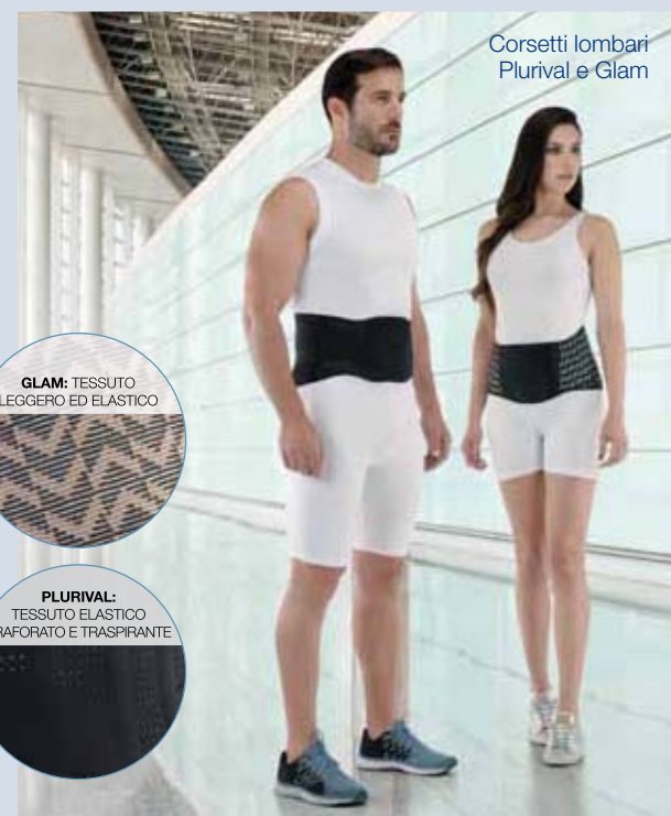
Corsetti lombari Plurival e Glam