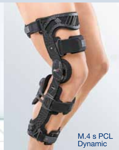
M.4 s PCL Dynamic