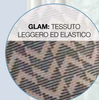
GLAM: TESSUTO LEGGERO ED ELASTICO

Basta indossare il nuovo corsetto Plurival per vestirsi di benessere tutto il giorno. Il design contenuto e la sua altezza ridotta semplificano ogni movimento e lo rendono un corsetto facilmente portabile in ogni momento. E a tutte le "lei" che oltre al benessere quotidiano cercano anche un tocco glamour, FGP dedica Glam: il corsetto dalla grande vestibilità, che unisce l'efficacia del sostegno delle stecche posteriori con l'eleganza del raffinato gioco cromatico riportato nella trama leggera ed elastica.