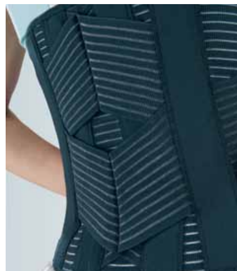
L'esclusivo incrocio a diamante: doppio sostegno, massimo controllo.

Indicato per prevenire le lombo-sciatalgie o in presenza di uno stadio doloroso lieve, il corsetto può essere indossato per svolgere in tutta normalità le attività quotidiane, anche quelle che richiedono sforzi fisici come sollevare pesi, e per attività sportive non agonistiche. Flexò. Solo le gioie della vita, senza dolori alla schiena.